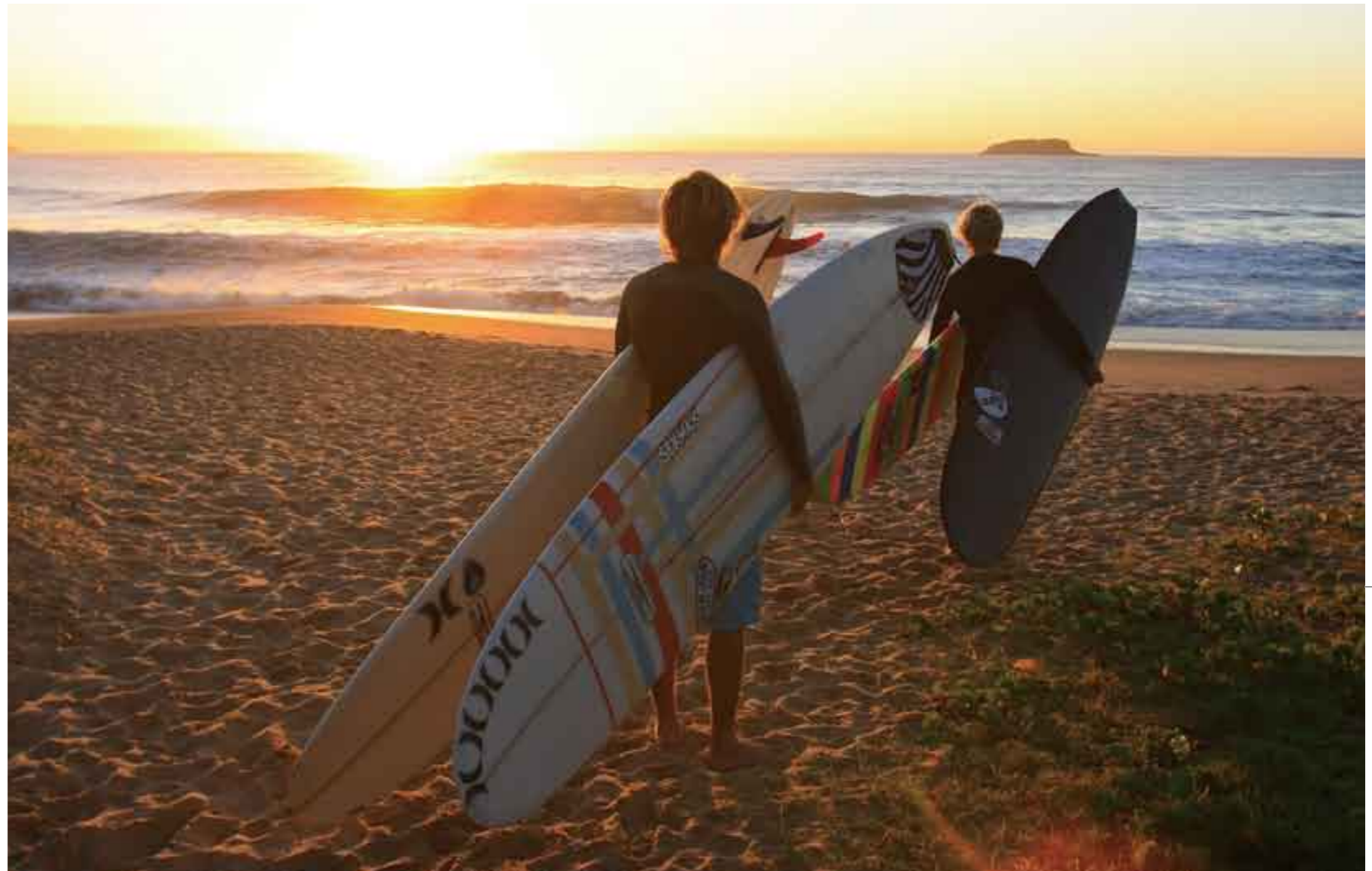
1: 誰もいない極上の波を、仲間だけで分け合う至福の瞬間。これぞ旅の醍醐味だろう 2: こんな極上の無人ラインナップを見つけたのも夢ではない 3: 疲れたら寝る。腹が減ったら食べる。起きたらサーフィンする。ただ、したいことをすればいい 4: オーストラリアのジュニア・チャンピオン、ハリー・ローチの鋭いリップリング・アクション

とにかくたくさん旅に出ること。 どの旅が人生最高の旅になるかもしれないなんて、 誰にも予測がつかないのだから。